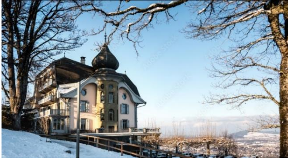
Restaurant Gurtners auf dem verschneiten Hausberg

Der Berner Hausberg lädt mit toller Aussicht über die Alpen zu einem gemütlichen Winterausflug ein. Im Restaurant Gurtners wartet danach leckere Küche in entspannter Atmosphäre. Wer möchte, kann noch etwas über den Hausberg spazieren bevor es dann wieder mit der Gurtenbahn abwärts geht.