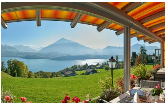
Bild: Aussicht Restaurant Panorama

Hoch über dem Thunersee liegt Aeschlen ob Gunten, ein Ort mit spektakulärer Aussicht auf See und Berge. Das gemütliche Restaurant Panorama lädt zum gemeinsamen Mittagessen und Verweilen ein. Wer mag, kann anschliessend noch einen Abstecher zur Hängebrücke machen.