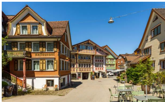
Bild: Die farbigen Häuschen im Appenzell

Im Mai machen wir ein Reisli ins Appenzell. Via Gossau und St. Gallen erkunden wir dort die bunten Häuser, die hübschen Gässchen und die lebendige Atmosphäre.