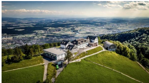
Bild: Weissenstein von oben

Im April geht's hoch hinaus: Von Solothurn aus fahren wir mit der Gondel auf den Weissenstein. Oben wartet ein Mittagessen mit traumhafter Sicht über das Mittelland bis zu den Alpen. Wer mag, kann einen Spaziergang unternehmen, bevor es gemütlich wieder talwärts geht.