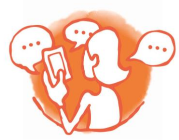
Digitale Beratung Chat von 8-18 Uhr