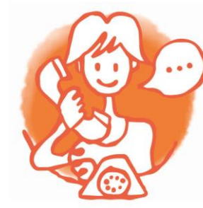
Telefonische Beratung (von 8 bis 19 Uhr)