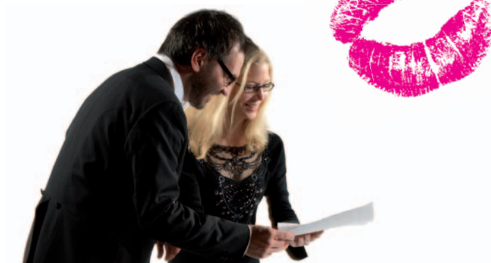
«BLICKEN SIE UNS ÜBER DIE SCHULTER!»

Mit persönlicher Einführung durch das BSO-Team Kultur-Casino Bern, Eintritt frei