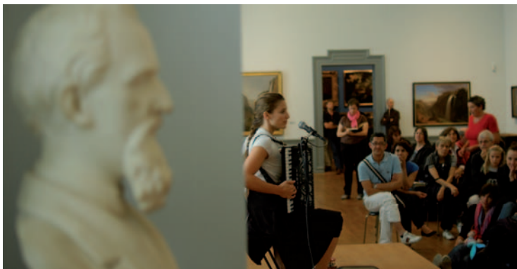
MUSEMÜNTSCHI 2009 IM KUNSTMUSEUM BERN

Führungen, Kinderprogramm, Performances, Prominente aus Politik und Kultur auf der Bühne, Kulinarisches ... Eintritt frei