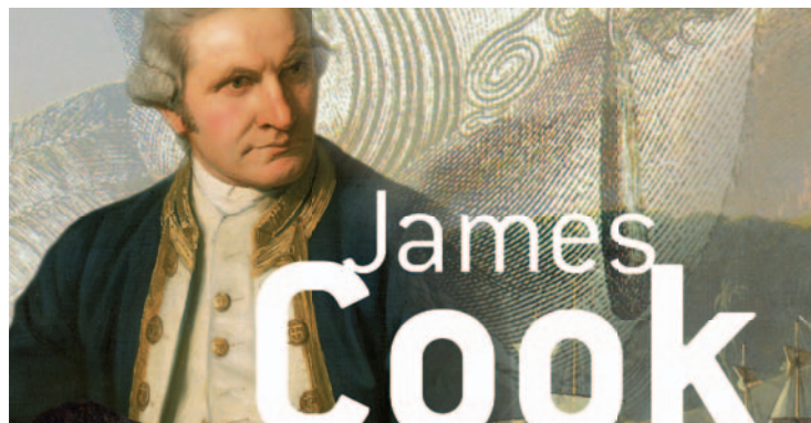
JAMES COOK UND DIE ENTDECKUNG DER SÜDSEE

Das Historische Museum Bern lädt ein zu einem Blick hinter die Kulissen der entstehenden Grossausstellung «James Cook und die Entdeckung der Südsee» (7.10.2010–13.2.2011).